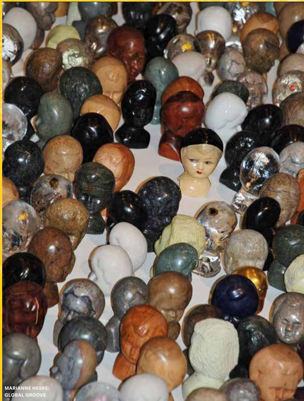
MARIANNE HESKE: GLOBAL GROOVE