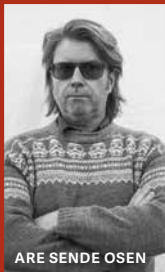
ARE SENDE OSEN